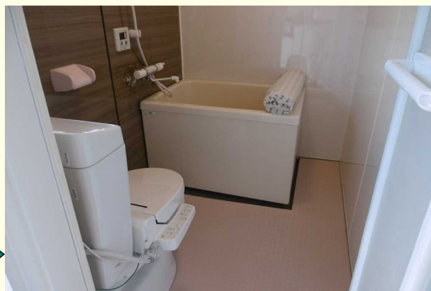
早く帰って、おしゃれな浴槽で今日の疲れを取りたい。そんな気持ちにさせる浴室になりました。