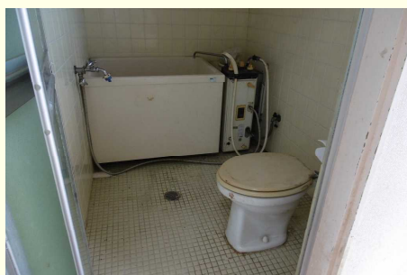
懐かしいタイルの床と壁

下写真は浴室とトイレが一緒になった古いタイプです。床と壁は懐かしいタイルが貼られていました。空間的にトイレと浴槽を別々にすることが出来ませんでしたので、思い切っておしゃれに仕上げしてみました。照明はおしゃれな電球色のランプを設け、壁には浴槽パネルを貼り、床には浴槽用のシートを敷きました。トイレは最新式のウォッシュレットに交換しました。