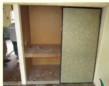
1間幅の古い押し入れ