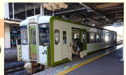
「八戸駅の青い森鉄道」

辛口は苦手なのでその旨をお話すると、甘くしてあげますよと軽く言ってくれました。料理の得意そうなおばさんで助かりました。広いレストランに若いカップルと私だけののんびりしたランチでした。