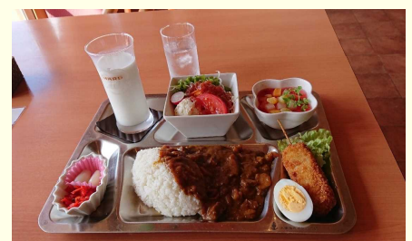
「大湊自衛隊グルメ」 護衛艦（おおよど）艦長認定 大湊海自カレー¥1,200円