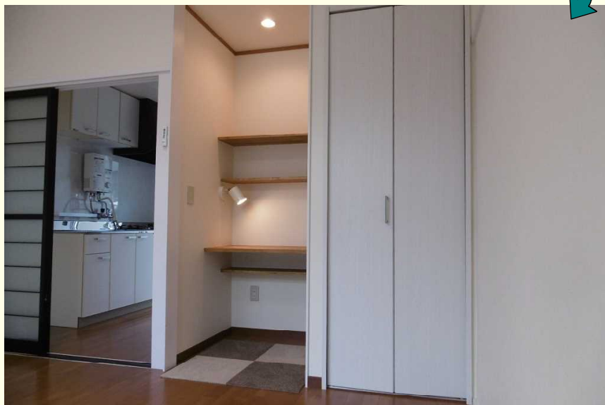
普通の押し入れもこんなにおしゃれに生まれ変わりました。

下写真は浴室とトイレが一緒になった古いタイプです。床と壁は懐かしいタイルが貼られていました。空間的にトイレと浴槽を別々にすることが出来ませんでしたので、思い切っておしゃれに仕上げしてみました。照明はおしゃれな電球色のランプを設け、壁には浴槽パネルを貼り、床には浴槽用のシートを敷きました。トイレは最新式のウォッシュレットに交換しました。