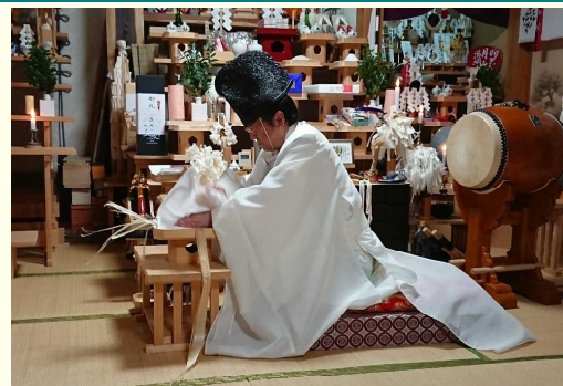
夏越の大祓（おおはらえ）

夏越の祓は、1月から6月までの半年間の災厄を清める儀式で、年越の祓は7月から12月までの穢れをはらうことが目的です。一年の終わりにあたることもあって、年越の祓のほうが盛大に行われることが多いのですが、夏越の祓も節目となる大切な行事です。